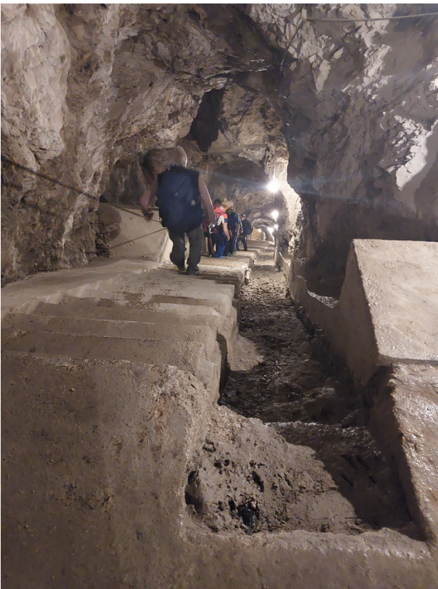
Tagliata del Ponale Circa 200 gradini tra 1° e 2° piano

Gruppo 1 (E) - Seguiremo la Strada del Ponale e, al bivio dopo il Ristorante Ponale Alto Belvedere, andremo a sinistra sulla strada per Pregàsina che seguiremo fino alla nostra meta: la statua della Regina Mundi dello scultore francescano Silvio Bottes, situata su un terrazzo montano affacciato sul Lago di Garda da cui si ammira un magnifico panorama. Dopo la sosta pranzo si tornerà indietro per la stessa strada. Giunti all'incrocio con l'Antica Via del Ponale, la si percorrerà fino a ricongiungerci con la Strada del Ponale e chiudere un piccolo anello. Continuando poi a scendere sulla Strada del Ponale arriveremo al Ristorante Ponale Alto Belvedere dove ritroveremo l'altro gruppo.