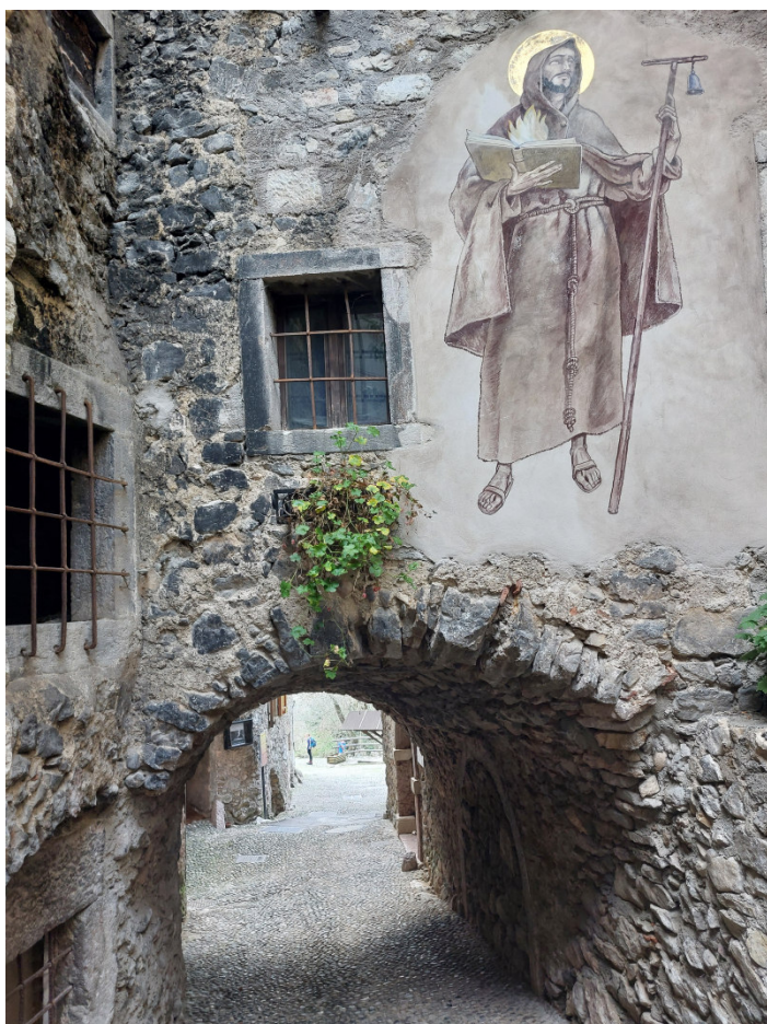
Canale di Tenno – Affresco su muro di casa medievale

lago, in meno di mezz'ora, torneremo a Canale di Tenno e si potrà procedere alla sua visita (libera). Le sue case in pietra, i ballatoi affacciati su viuzze silenziose, le volte a botte e i gerani che colorano finestre e poggioli hanno attratto sin dal secondo dopoguerra artisti da tutta Europa, ispirati dai suoi scorci e dal paesaggio circostante che consente di avere una meravigliosa visuale sul lago di Garda. Tra tutti il pittore torinese Giacomo Vittone che scelse Canale come soggetto per molte sue opere. È a lui che oggi è intitolata la Casa degli Artisti, luogo di dimora e ritrovo per gli artisti che visitano il borgo. Dopo aver vagato per le viuzze del borgo, si potrà fare sosta, per l'appunto, alla Casa degli Artisti e al Museo degli Attrezzi Agricoli. Poco fuori il borgo c'è invece la statua della "Vicinia delle Ville del Monte", che ricorda l'antica forma di amministrazione autonoma che comprendeva Canale di Tenno e i borghi circostanti. Concluderemo la giornata spostandoci in pullman a Ponte Arche per raggiungere l'Hotel Bel Sit per il pernottamento.