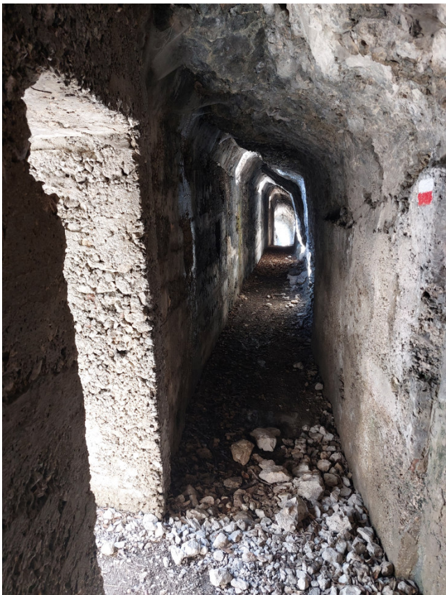
Defensionmauer Lunga fuciliera in cemento armato con feritoie verso sud

Gruppo 2 (EE) - Usciti dalla Tagliata del Ponale seguiremo la Strada del Ponale per circa 500 metri, poi sulla destra troveremo il sentiero 405 che con un ripido balzo di 300 m ci porterà ai 470 m del Defensionmauer, complesso di fortificazioni posto al di sopra della Strada e della Tagliata del Ponale, a difesa dell'Alto Garda e della Valle di Ledro. Durante la Prima Guerra Mondiale la Valle di Ledro si trovava al confine tra l'Impero Austro-Ungarico, di cui faceva parte, e il Regno d'Italia. La popolazione civile fu dunque evacuata dal fondovalle (per la maggior parte in Boemia) mentre Kaiserjäger, Standschützen e Alpini si contendevano il controllo della Valle e delle montagne circostanti. Proseguiremo con il sentiero 472, molto trafficato, essendo il sentiero d'accesso alle numerose vie di arrampicata e ferrate su falesia del settore Cima Capi-Ledro, fino a discendere nuovamente sulla Strada del Ponale che seguiremo fino al Ristorante Ponale Alto Belvedere per ricongiungerci con l'altro gruppo. A gruppo riunito, continuando sulla strada del Ponale, si ritorna a Riva del Garda per il rientro ad Asti.