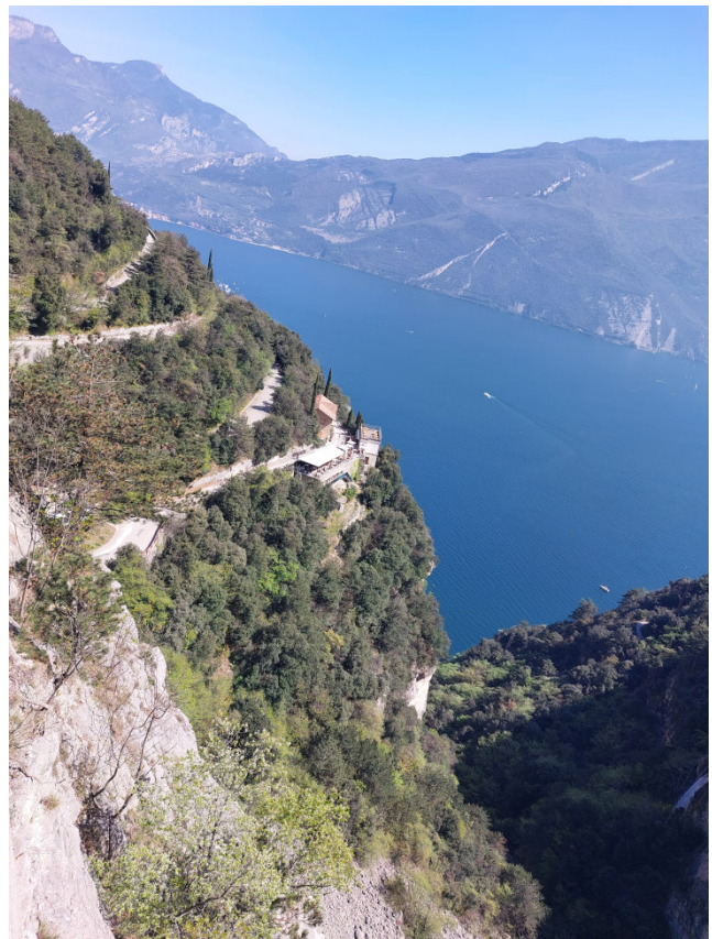
Sulle Zete della Strada del Ponale Vista del Lago di Garda