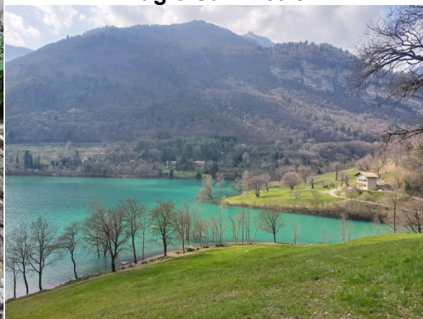
Lago di Tenno