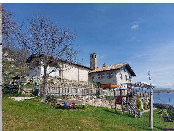
Rifugio San Pietro